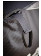
レスキューアジャスト