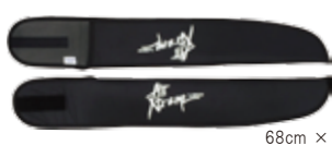
■APCO 2pc プロペラカバー (スリム) ¥4,600+税