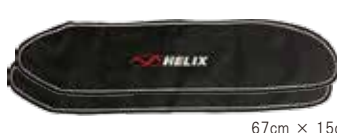
■Helix 2pc プロペラカバー ¥5,000+税