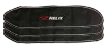
■Helix 3pc プロペラカバー ¥7,500+税