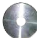
汎用 (大) ¥4,000+税