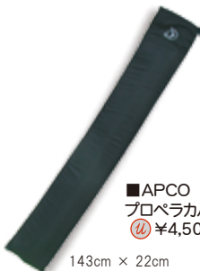
■APCO プロペラカバー ¥4,500+税