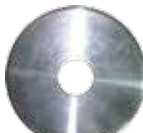
汎用 (特大) ¥6,000+税