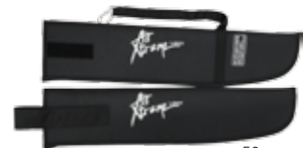
■APCO 2pc プロペラカバー ワイド ¥4,600+税